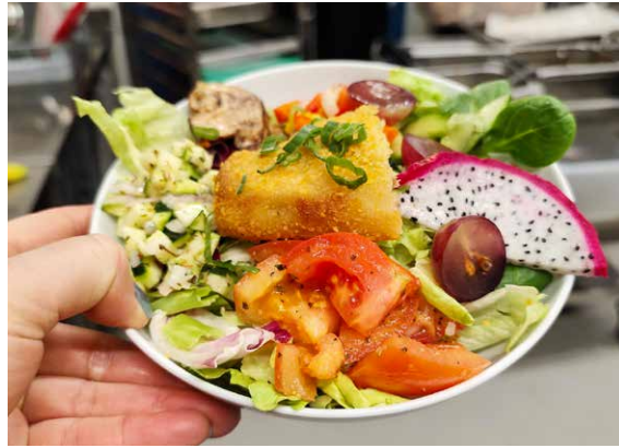
Beim Sunntigsnacht wird Wert auf Qualität gelegt: Vorspeisensalat mit Erdbeersalatsauce.

Überrascht war ich von der Vielfalt der Gäste an diesem Abend. Es wurde deutlich, dass im Sunntigsnacht unterschiedliche Lebensrealitäten aufeinandertreffen, Menschen mit sehr verschiedenen Hintergründen, Situationen und Bedürfnissen. Für mich war das ein Moment, der gezeigt hat: Solche Angebote sind nicht nur Essensausgabe, sondern auch sozialer Raum. Und damit beinhalten sie immer auch Aushandlung, Regeln und Koordination.