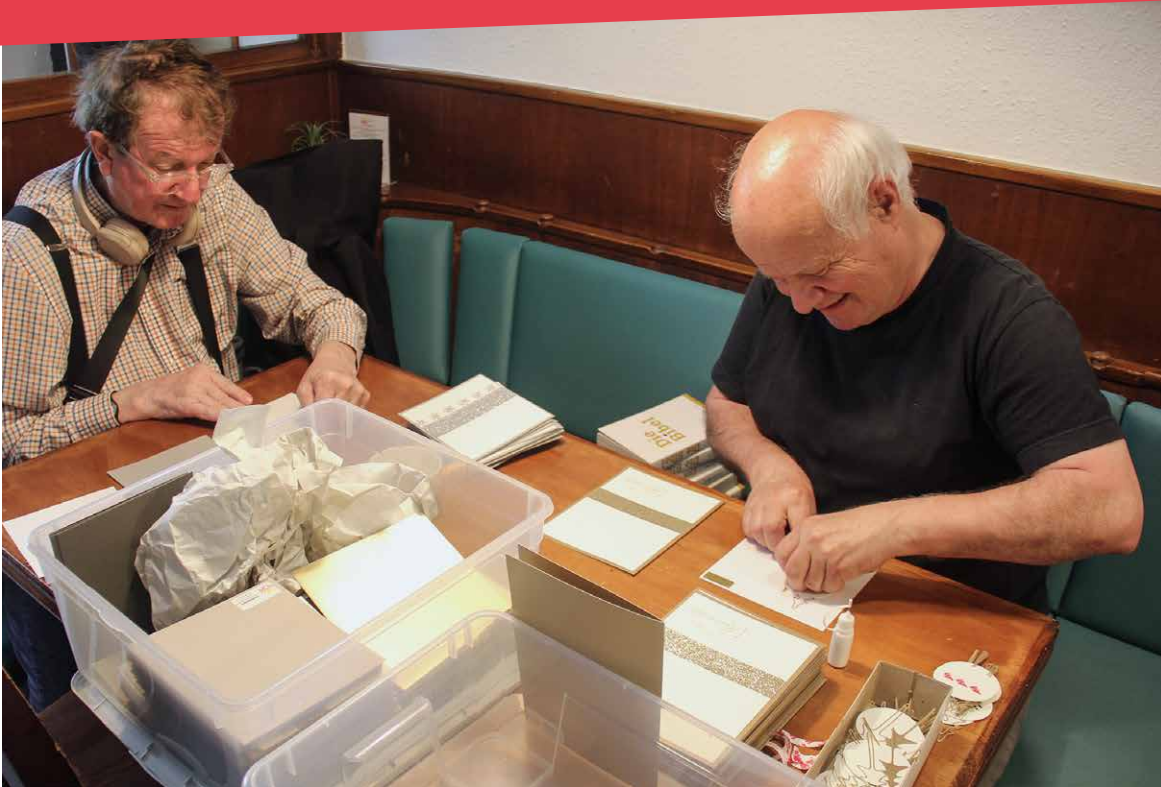
Das gemeinsame Gestalten von Karten ist eine sinnvolle Beschäftigung, stärkt das Selbstbewusstsein und fördert das Gemeinschaftsgefühl.

nehmen möchten. Nebst den bereits genannten saisonalen Aktivitäten profitieren auch die regelmässigen Angebote von der Unterstützung. So sind dienstags drei oder vier Freiwillige bei der Lebensmittelabgabe im Einsatz, bei den Gassenteams Baden und Brugg begleitet je ein:e Freiwillige:r eine Fachperson bei der Gassenarbeit, im Restaurant unterstützen sie beim Service, Rüsten sowie bei Reinigungsarbeiten und auch der Sonntagstreff darf jeweils auf die Hilfe von zwei oder drei Personen zählen.